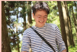
高橋匡太 Kyota Takahashi

1970年京都生まれ。1995年京都市芸術大学大学院美術研究科彫刻専攻修了。 光や映像によるパブリックプロジェクション、インスタレーション、 パフォーマンス公演など幅広く国内外で活動を行っている。 東京駅100周年記念ライトアップ、京都・二条城、十和田市現代美術館など 大規模な建築物のライティングプロジェクトは、ダイナミックで造形的な 映像と光の作品を創り出す。